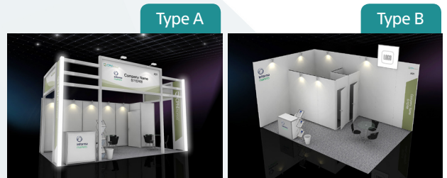
부스 상단 그래픽 제공

* 모든 그래픽 파일은 참가업체가 제공해야 함 ** 해당 부스 이미지는 샘플 이미지로 추후 변경될 수 있음